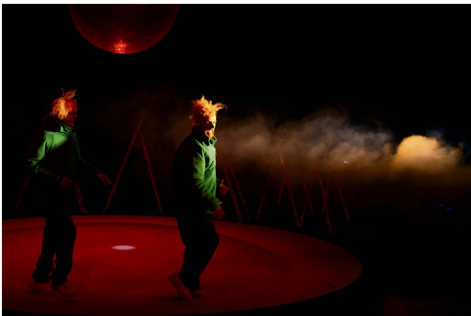
Le duo ne cède à aucune facilité, ce qui rend la fièvre du jeune public encore plus magique et le charme de ce spectacle encore plus grand. (ARIANE CATTON)