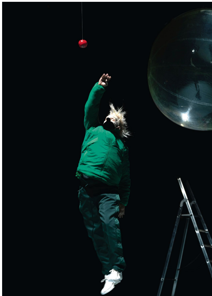
SCÈNE «Actapalabra», magnifique fantasmagorie sans paroles pour deux clowns lancée par le Théâtre Am Stram Gram, déchaine le jeune public. Après Genève, le spectacle tournera à Paris, puis à Lausanne. (ARIANE CATTON)